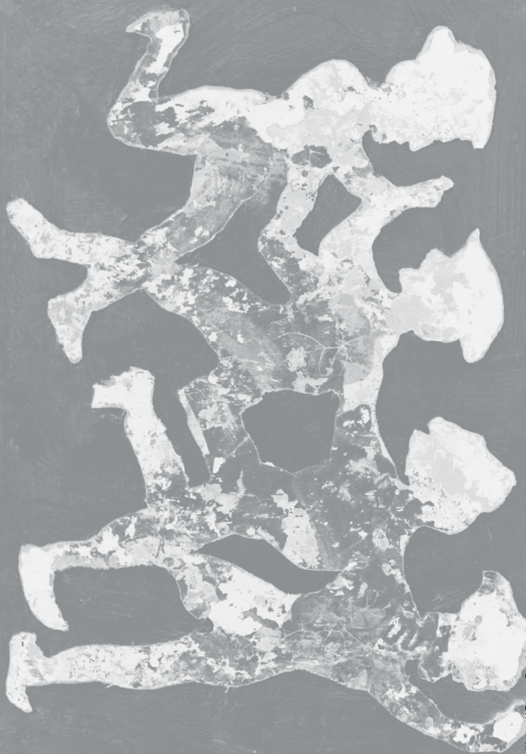
Il·lustració Thomas Perroteau